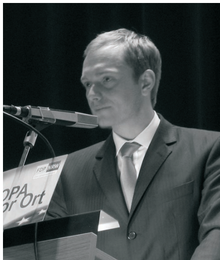
Der Neue ist ein JuLi: Generalsekretär Christian Lindner

Der Sonntag war von der Rede des Bundesvorsitzenden der FDP, Dr. Guido Westerwelle, geprägt. Am Ende hat Westerwelle eine emotionale Seite gezeigt, und der Partei für die Unterstützung der vergangenen Wochen gedankt. Mir persönlich jedoch, hat die Rede nicht ganz so gut gefallen.